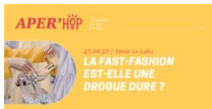
Campagne contre la mode jetable