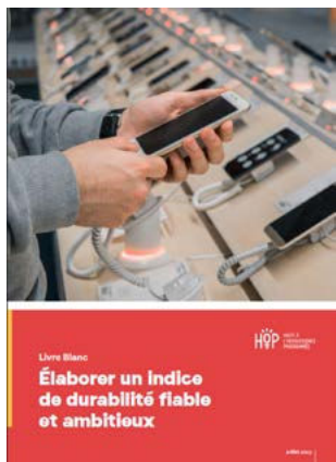
Livret Blanc sur l'indice de durabilité