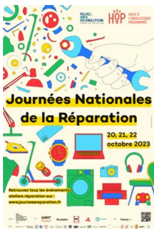
Affiche Journées Nationales de la Réparation