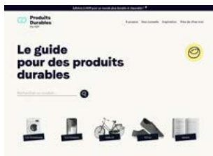
Nouvelle charte graphique et nouveau site écoconçu