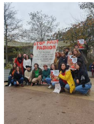
Participation à l'action Stop Fast Fashion

39 articles d'information sur nos actions ont été publiés sur notre site principal halteobsolescence.org pour 46 500 visites, soit une augmentation de 141 % par rapport à 2022 !