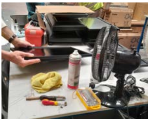
Activités du Club de la Durabilité