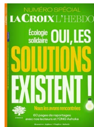
Mise à l'honneur dans un numéro spécial du magazine La Croix - L'Hebdo en septembre