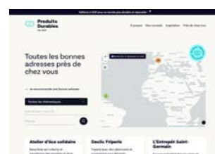
Lancement de la carte « Près de chez moi » sur Produits Durables