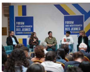
Forum international des jeunes leaders au Maroc