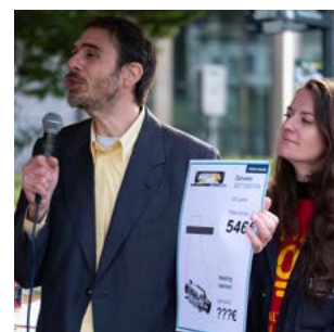
Copilotage de la campagne Right to Repair