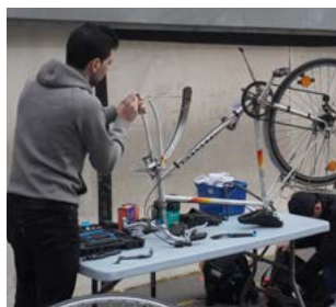
© Jules Fischer. Atelier de réparation de vélo à Paris lors des Journées Nationales de la Réparation