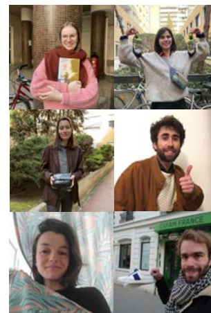
Campagne de sensibilisation sur l'achat durable et l'entretien

Entretien ses produits, c'est bien souvent rébarbatif. Pourtant, c'est le meilleur réflexe à adopter pour les faire durer. Pour rendre cette tâche moins monotone, nous avons publié différentes playlists sur Spotify pour bichonner ses objets en musique ou en écoutant des podcasts sur des sujets liés à l'économie circulaire. À cette occasion, nous avons déployé une campagne sur les réseaux sociaux pour faire connaître les playlists et sensibiliser à l'entretien.