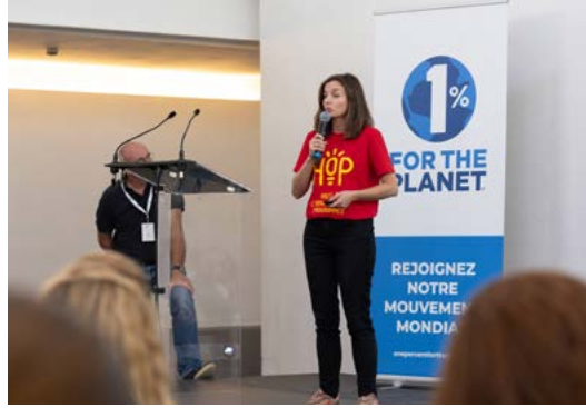
Participation aux Rencontres pour la planète organisées par 1% for the Planet.