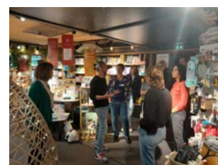
Groupes de travail du Club de la durabilité