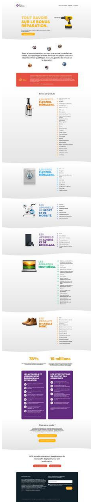
Site du bonus réparation : bonusreparation.org

Pour mettre fin à l'obsolescence programmée, HOP n'a d'autre choix que de se battre pour faire bouger les lignes et obtenir des normes ambitieuses et contraignantes envers les fabricants. Le plaidoyer est une composante essentielle de l'ADN de l'association et l'année 2023 a été une nouvelle fois riche en actions d'influence. Notre travail de plaidoyer nous a amenés à participer à de nombreuses réunions institutionnelles à l'échelle française et européenne. 158 132 réparations d'équipements électriques et électroniques ont été réalisées grâce au bonus réparation obtenu par HOP, réparties sur 4 641 points de réparation. Plus de 30 millions de produits vendus chaque année sont concernés par l'indice de réparabilité.