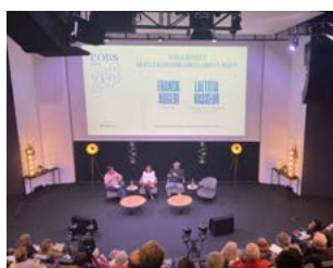
Conférence à l'Obs