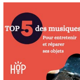
Campagne d'été avec des playlists sur Spotify