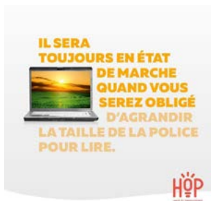
Campagne sur le Bonus Réparation